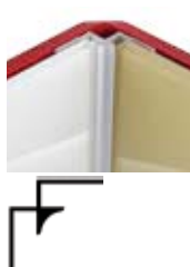
ZNEX0002 90° Innenwinkel