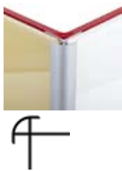
ZNEX0001 90° Aussenwinkel