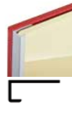
ZNEX0004 Gerades Abschlussprofil