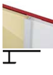
ZNEX0003 Gerade Stossverbindung